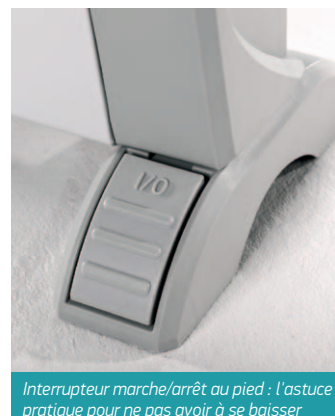
Interrupteur marche/arrêt au pied : l'astuce pratique pour ne pas avoir à se baisser