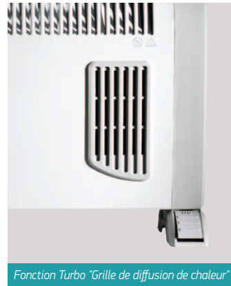
Fonction Turbo "Grille de diffusion de chaleur"