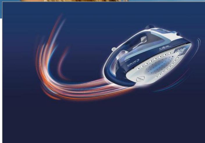
EASYGLISS PLUS 2700 W BLEU ET BLANC FER A REPASSER FV5750C0